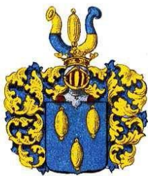
Boije af Gennäs vapensköld